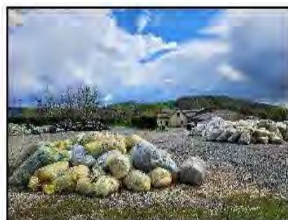
Saint Germain du Teil - Collecte 2025